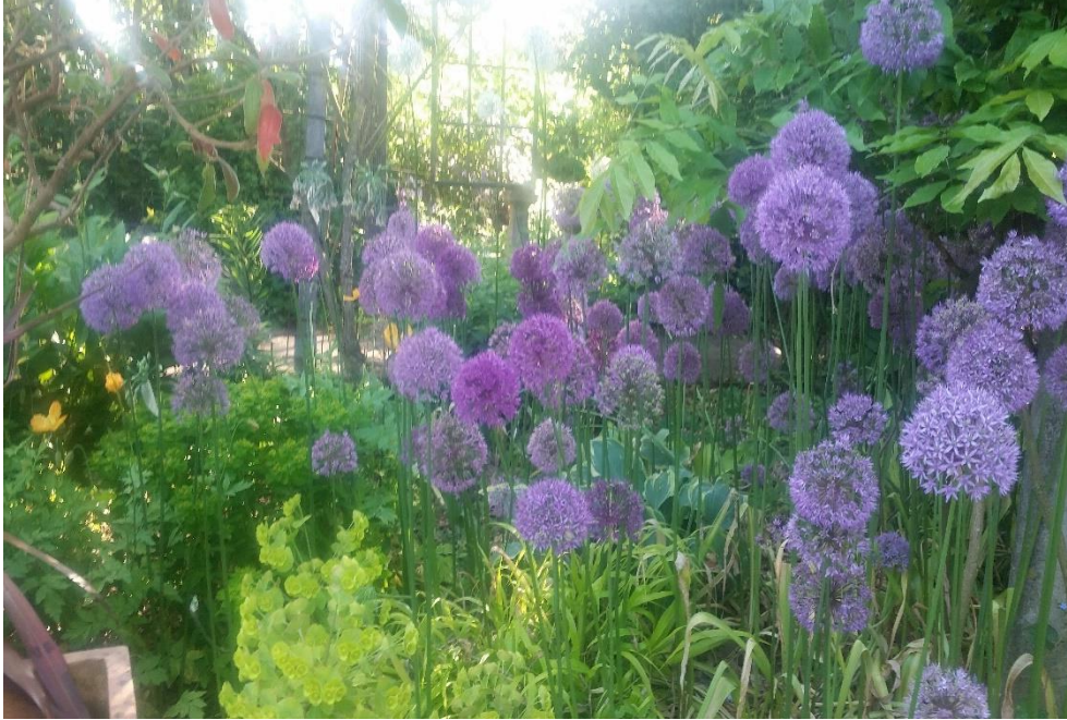
Oben: Allium (hier Allium aflatunense „Purple Sensation“)